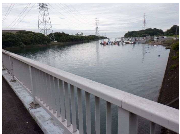
写真 日吉原橋近傍